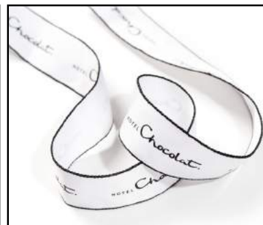
Satin polyester aspect coton mat