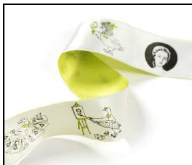
Impression offset recto + verso en aplat