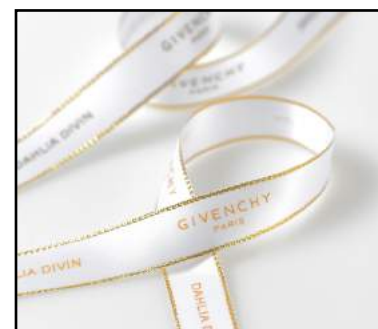
Satin avec lisière lurex chaine + impression sérigraphie