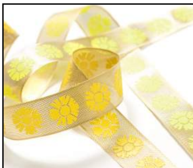
Impression relief sur ruban lurex lamé