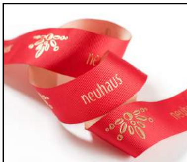
Impression transfert deux faces + dorure relief