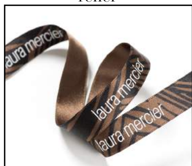
Satin impression une couleur + relief blanc