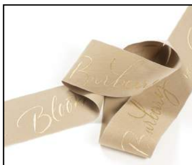
Ruban gabardine polyester recyclé + impression relief or