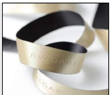
Satin lurex dorure relief or mat + transfert numérique noir au verso