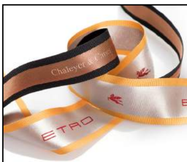
Ruban gros grain polyester bande centrale viscose + impression relief