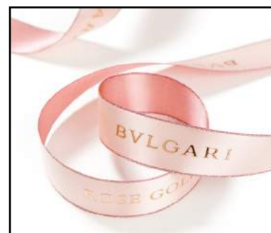
Satin avec lisière lurex impression relief cuivre et à plat au verso