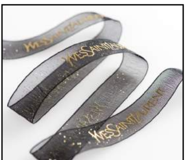
Ruban organdi impression dorure relief